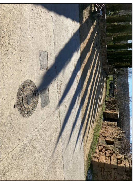
VISTA DE ACCESO EXISTENTE 1 A LA FINCA

DOTACIONES URBANISTICAS EXISTENTES EN LA CALLE REAL: LINEA ELECTRICA ENTERRADA RED DE SANEAMIENTO ENTERRADO RED DE AGUA POTABLE ENTERRADA ACCESO PAVIMENTADO ALUMBRADO PBLICO