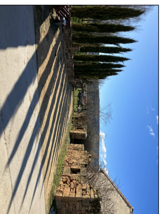
VISTA DE ACCESO EXISTENTE 1 A LA FINCA