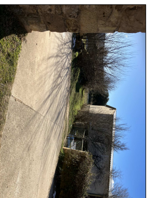
VISTA DE ACCESO EXISTENTE 2 A LA FINCA

DOTACIONES URBANISTICAS EXISTENTES EN LA CALLE REAL: LINEA ELECTRICA ENTERRADA RED DE SANEAMIENTO ENTERRADO RED DE AGUA POTABLE ENTERRADA ACCESO PAVIMENTADO ALUMBRADO PBLICO