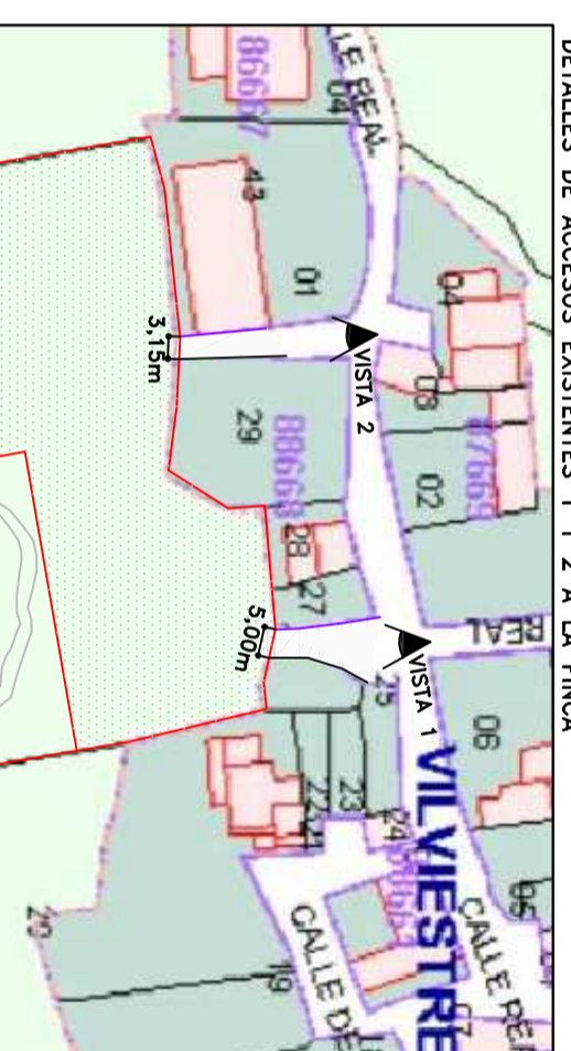
DETALLES DE ACCESOS EXISTENTES 1 Y 2 A LA FINCA